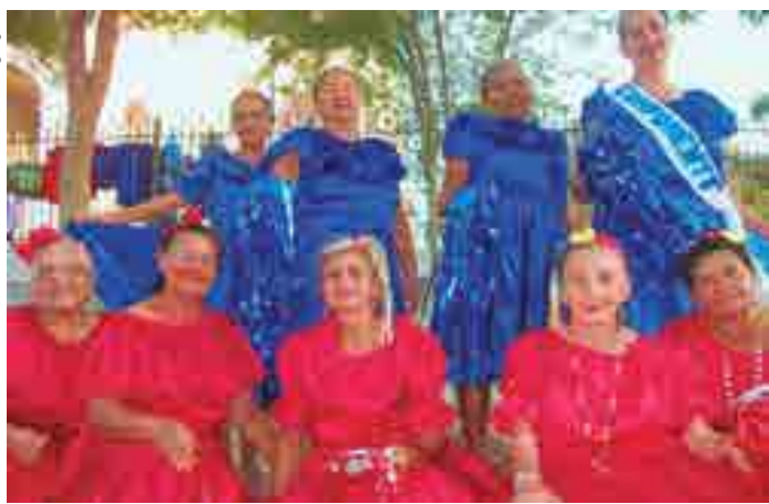
Registro de uma das muitas atividades realizadas pela organização