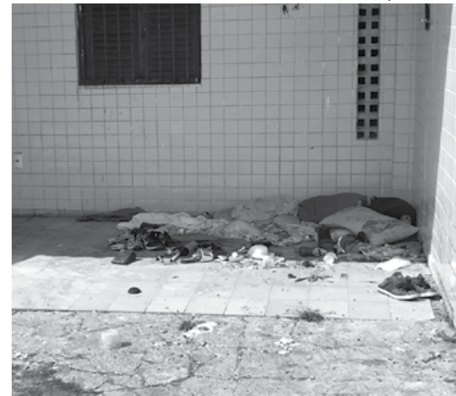
“Há semanas ele achou aquele cantinho, sem poder chamar de seu”