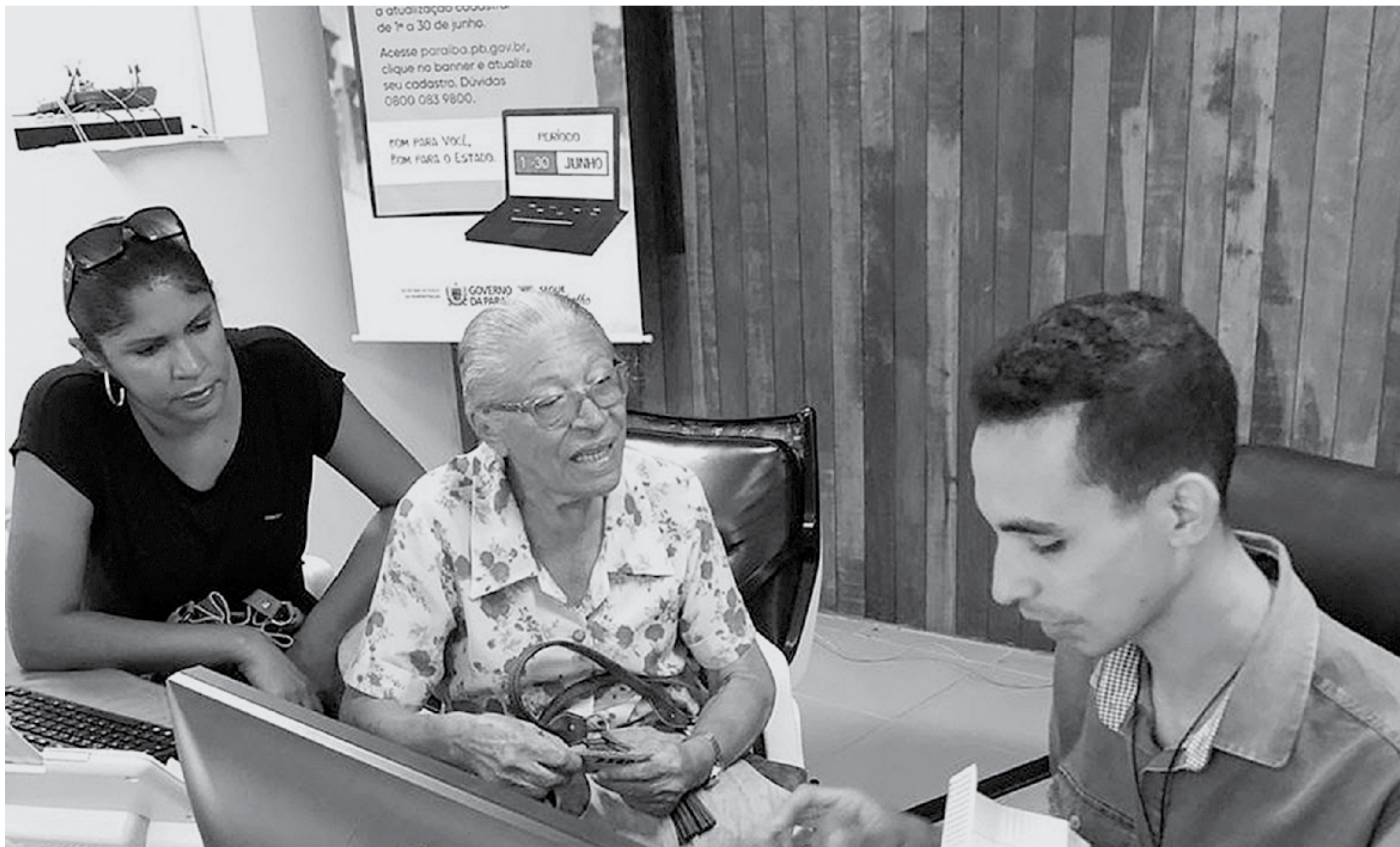
A previsão era de que a realização da prova de vida de aposentados e pensionistas da Previdência da Paraíba fosse retomada no último mês de julho, mas o Governo do Estado decidiu prosseguir com a suspensão por conta da pandemia