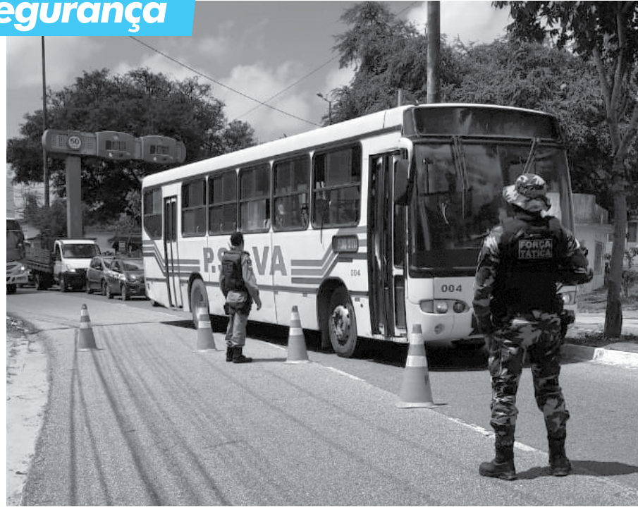
'Ônibus Seguro': coletivos de João Pessoa foram parados em vários pontos da cidade e os passageiros, vistoriados pelos policiais militares